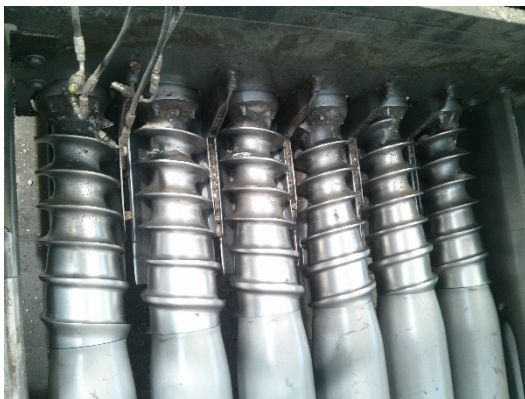
VITI H200 Screws H200