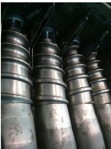
VITI H360/400/500 Screws H360/400/500

INERTE Dolomia + Calcareo al 79% Concrete: Dolostone + Limestone at 79%