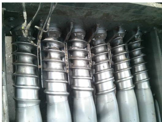
ШНЕКИ H200 Произведено M²: 21000 БЕТОН: Доломит + Известняк 79%