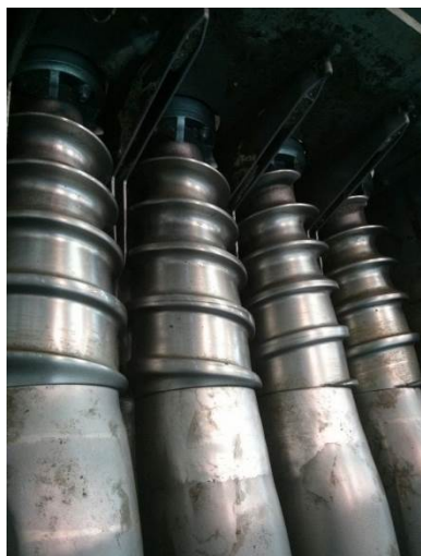
ШНЕКИ H360/400/500 Произведено M²: 23500 БЕТОН: Доломит + Известняк 79%